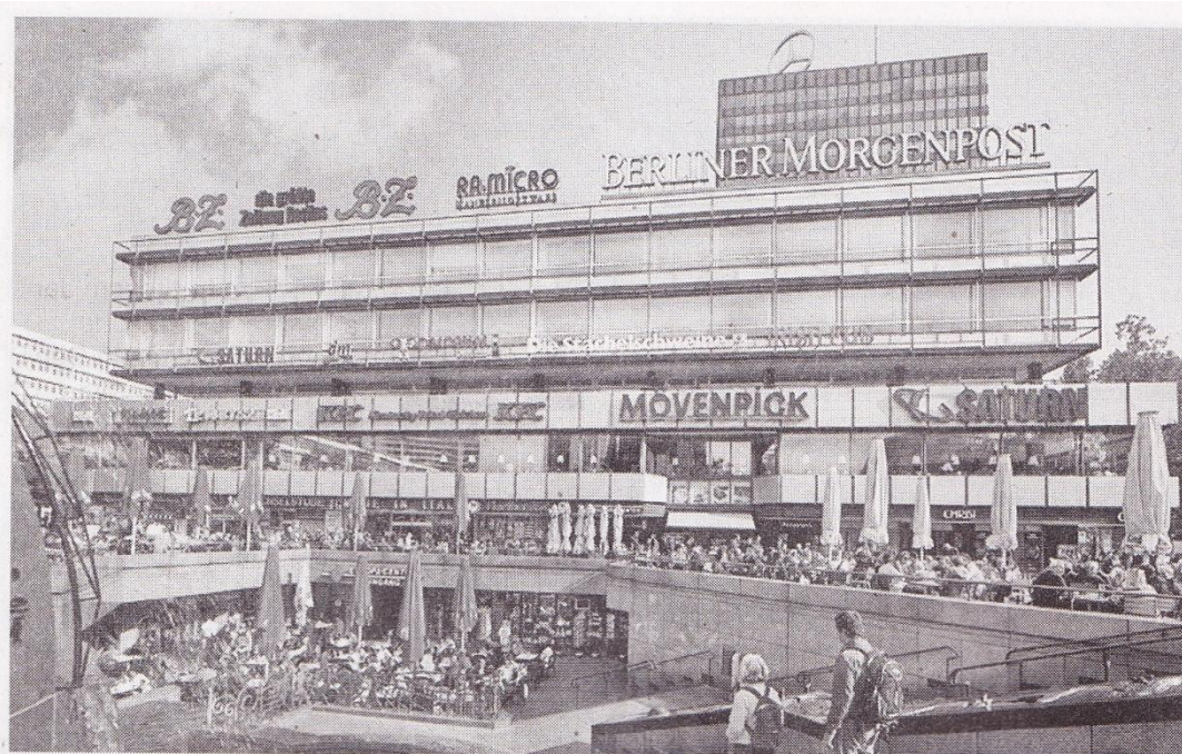
Das Europa-Center am Breitscheidplatz